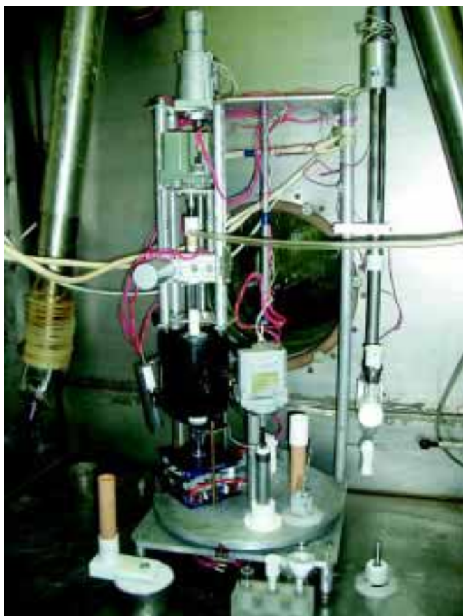
Рис. 4. Установка для синтезу натрію йодиду- ^{131}\text{I}

нератор розробки ІЯД від відомих моделей інших виробників. Після встановлення колонки і захисної пробки з повітряним фільтром і комунікаціями генератор видаляють з «гарячої» камери для кінцевого збирання. Елюювання генератора ізотонічним розчином натрію хлориду здійснюється вакуумованими флаконами, розміщеними в захисному контейнері. Генератор забезпечує елювання до 70% ^{99\text{m}}\text{Tc} у 10 мл елюату. Гелевий генератор технецію представлено на рис. 3.