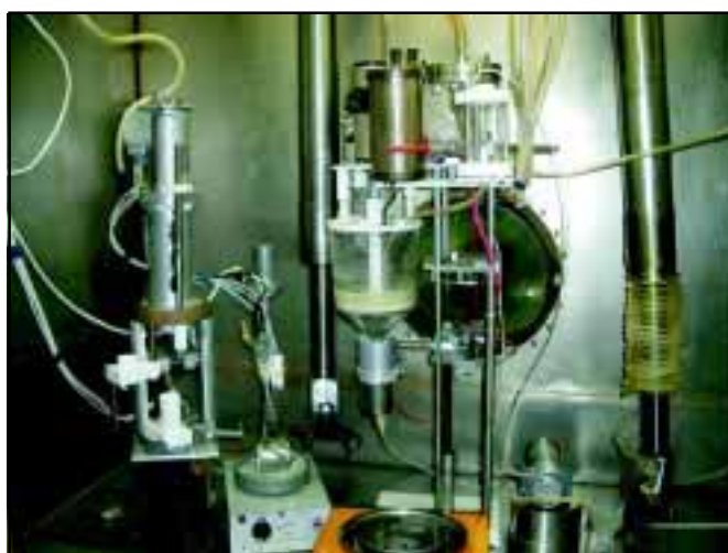
Рис. 2. Установка для синтезу Мо-Zr-гелю і модуль для збирання хроматографічних колонок

У лабораторії радіонуклідів і РФП для отримання натрію пертехнетату- 99m Tc розроблено портативний генератор 99 Mo/ 99m Tc для використання безпосередньо в медичних закладах всієї України. Робочим матеріалом генератора слугує Мо-Zr-гель, що синтезується з використанням 99 Mo, який утворюється при опроміненні природного оксиду молибдену нейтронами реактора. Установка з синтезу гелю дозволяє переробити за один цикл до 20 г оксиду молибдену. Ця установка і модуль для збирання хроматографічної колонки генератора розміщені в «гарячій» камері (рис. 2). Управління виконавчими механізмами здійснюється оператором пульта дистанційного керування. Порошок Мо-Zr-гелю засипається в хроматографічні колонки, які герметично закриваються за допомогою модуля збирання колонок і передаються у сусідню камеру для встановлення в корпус генератора. Встановлення стерилізувального фільтра власної конструкції на виході дає додаткову гарантію стерильності препарату і відрізняє ге-