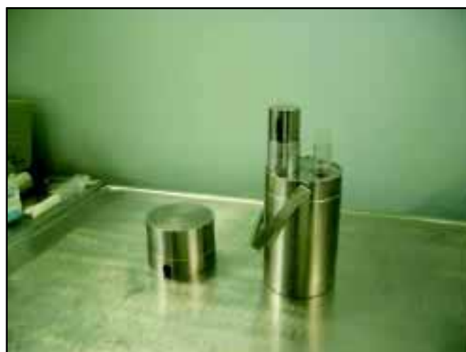
Рис. 3. Гелевий генератор 99m Tc