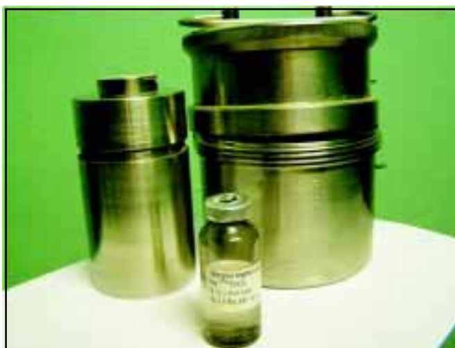
Рис. 1. Пакувально-транспортний комплект розчину натрію пертехнетату- 99m Tc