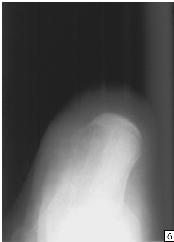
Рис. 1 — Остеомієліт правої п'яткової кістки. Ділянка деструкції розміром 2,5 \times 1,5 см з чіткими контурами локалізується в задній ділянці тіла п'яткової кістки. Процес поширюється на росткову зону і виходить за межі кістки