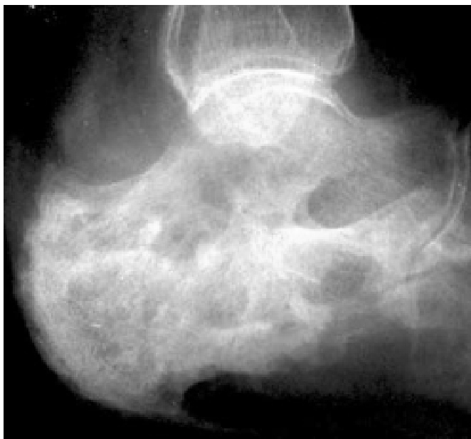
Рис. 5 — Хронічний остеомієліт лівої п'яткової кістки, секвестральна форма. Анкілоз підтаранного суглоба. Деформівний артроз у суглобі Шопара

Fig. 5 — Chronic osteomyelitis of the left calcaneus bone, sequestral type. Ankylosis of the subtalar joint. Arthrosis derormans in Chopart's joint