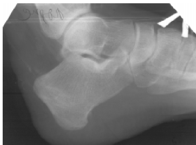
Рис. 2 — Порушення розвитку горба п'яткової кістки як результат перенесеного остеомієліту

Віддалені результати хронічного гематогенного остеомієліту у функціональному плані кінцівки, як правило, незадовільні й залежать від вчасності та комплексності лікування. Знижується функція стопи. Втрата рухової і зниження опорної функцій супроводжується розвитком дегенеративних змін у суглобах — розвивається деформівний артроз, рідше з кістковою перебудовою дотикових поверхонь як у близьких, так і віддалених гомілковотаранному і колінному суглобах кінцівки. Розвиток анкілозу при хронічному остеомієліті є адаптаційно-компенсаторною реакцією на відновлення опорної функції стопи.