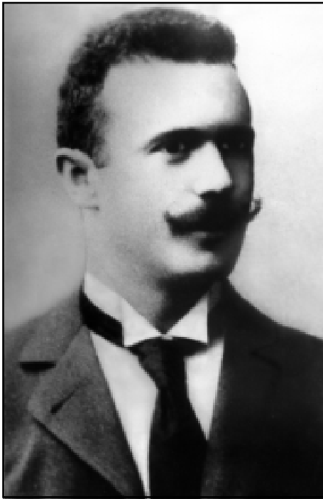
Яків Мойсейович Розенблат (1872–1928)

У когорті славних імен знаменитих одеситів, згадка про яких звучить як символ міста, по праву має значитися і це — Якова Мойсейовича Розенблата, основоположника практичної вітчизняної рентгенології, який багато зробив для того, щоб рентгенівський промінь міг діагностувати й лікувати людські недуги. Мені шкода, що про видатного вченого, добре відомого у вузькому колі фахівців, мало що знають багато моїх земляків і співвітчизників. Між тим, своїм лікарським і людським подвигом він заслужив право завжди залишатися в пам'яті нащадків. Спробую хоч би якоюсь мірою надолужити прикру прогалину краєзнавства і розповісти читачам про цю дивну людину.