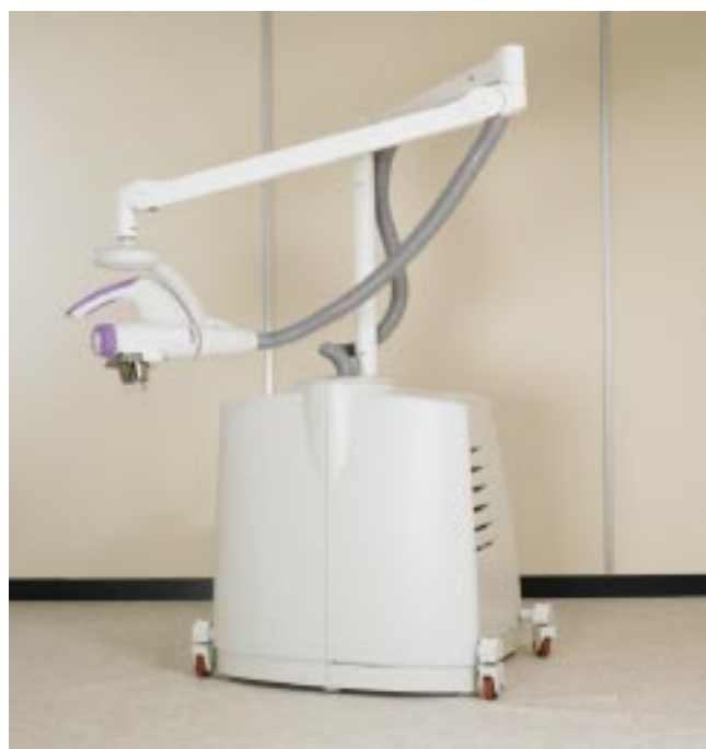
Рисунок 3. Рентгеновський терапевтичний апарат Xstrahl 100

\pm 3\% від номінального значення (рисунок 3). Система комплектується дев'ятьма фільтрами-аплікаторами з прозорою кінцевою секцією, що полегшує візуальний контроль зони опромінення. Моделі Xstrahl 200 і 300 комплектуються системами верифікації пацієнтів, які забезпечують повний контроль лікувального процесу (сеансу терапії та моніторингу дози).