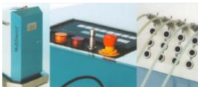
Рисунок 2. Система MultiSource HDR для високодозної брахітерапії

З цієї точки зору слід детальніше зупинитися на відносно новому для ринку України шланговому апараті MultiSource із системою планування високодозної терапії HDR plus™ німецької компанії IBt Bebig, 3 одиниці якого в 2010 році було поставлено в Київ (Національний інститут раку), Одесу та Херсон (рисунок 2).